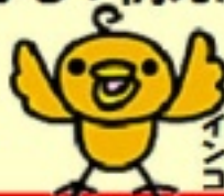
カンピロバクター